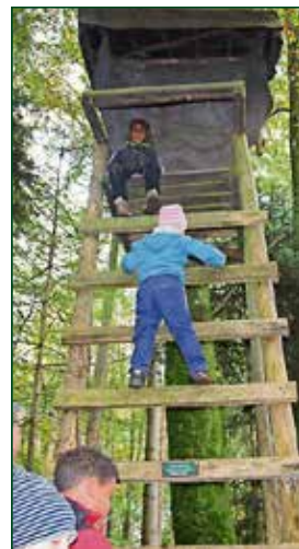
Klettern auf den Jagd-Hochsitz.

Die für die Schnupper-Aktivitäten involvierten Vereine begrüssen das «Rägi Camp» und nehmen dies als Werbe-Plattform in eigener Sache wahr. Und natürlich auch zur Nachwuchsförderung. Auch deshalb dürfte das «Rägi Camp» noch weit über sein aktuelles Jubiläum Bestand haben und auch künftig für tolle Erlebnisse und leuchtende Augen bei Teilnehmern und Helfern oder Instruktoren sorgen.