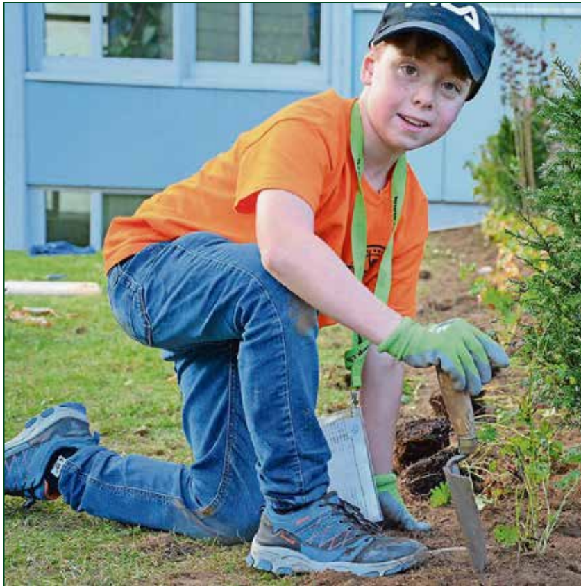
Das Rägi Camp hat auch dieses Jahr wieder viel zu bieten - nun ist Anmeldestart.

Auch in diesem Jahr sollen beeinträchtigte Kinder am Rägi Camp mitmachen können. «Der Inklusionstag vom