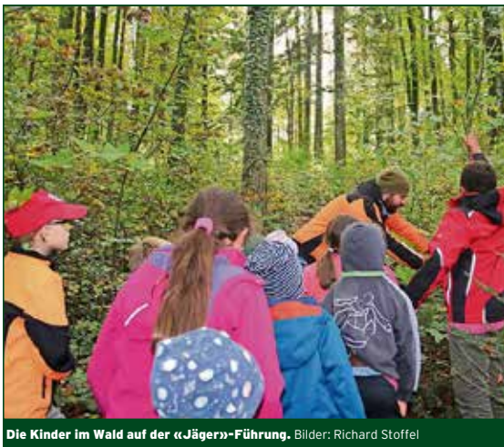
Die Kinder im Wald auf der «Jäger»-Führung.

Digitale Tools ermöglichten auch Flexibilität innerhalb der Camp-Organisation. Via QR-Code konnte man die aktuellen Verfügbarkeiten der vorhandenen Plätze für die einzelnen Aktivitäten abrufen. So konnte man noch am Vormittag entsprechende Nachmittags-Präferenzen umdisponieren, beziehungsweise Änderungswünsche vornehmen.