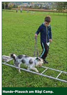
Hunde-Plausch am Rägi Camp.